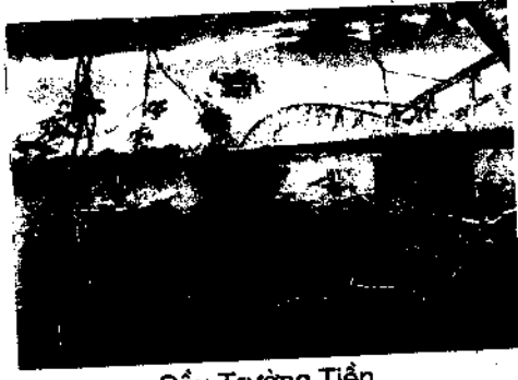
Cầu Trường Tiền